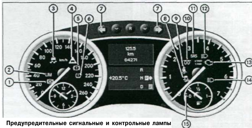
Предупредительные сигнальные и контрольные лампы