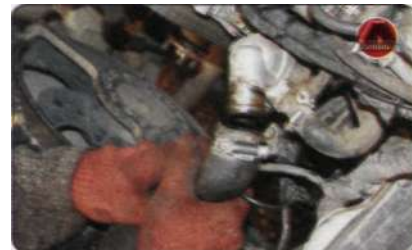
8. Ослабить хомут и отсоединить верхний шланг от радиатора.

...и отсоединить верхний радиатора от термостата.