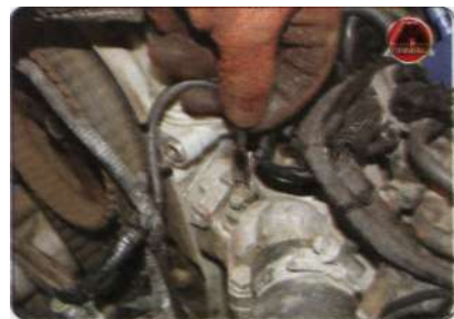
7. Ослабить хомут...