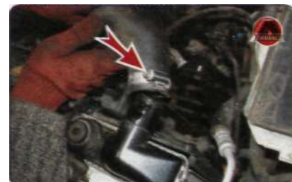
9. Ослабить хомут и отсоединить шланг охлаждающей жидкости от термостата.