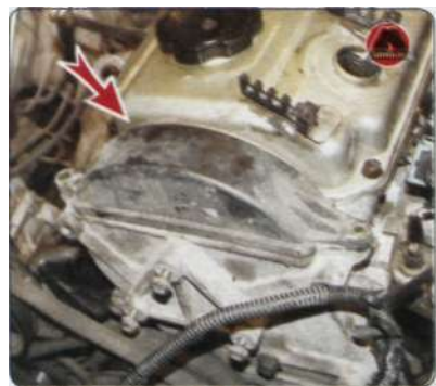
7. Подсоединить высоковольтные провода к свечам зажигания.