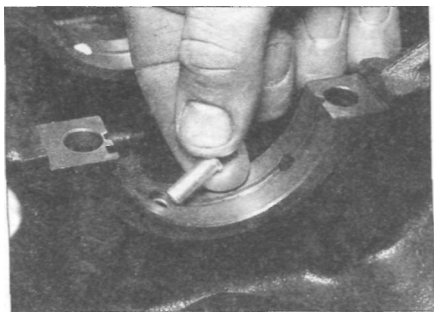
Рис. 11.2,а. Извлеките форсунки подачи масла на поршни (двигатели объемом 2.0 и 2.2 литра)